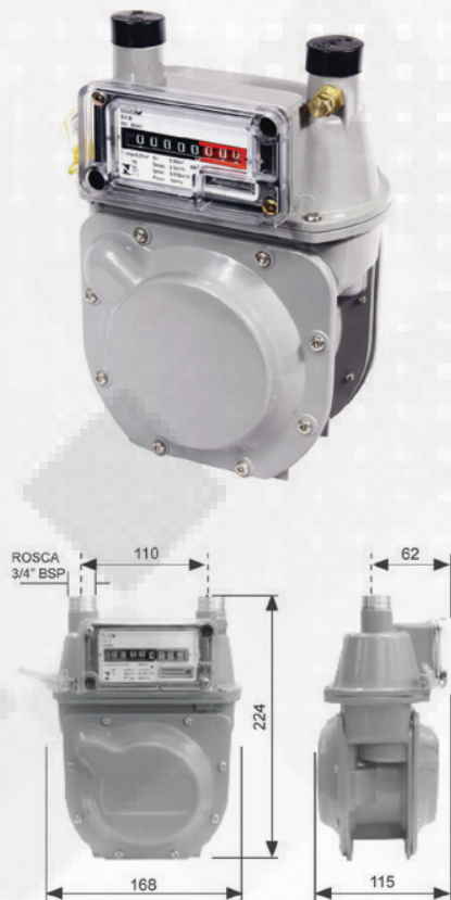
Dimensões em mm