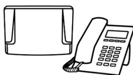
Central Telefônica e Telefone